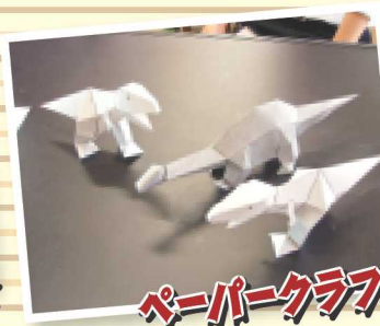
ペーパークラフト